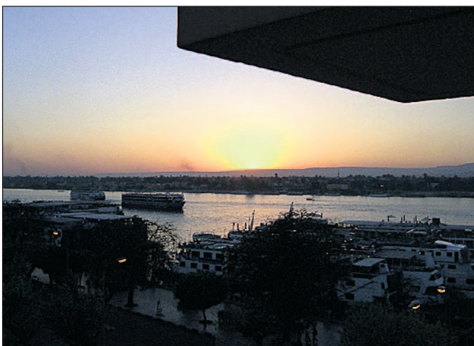
Mit einer Länge von rund 6.800 Kilometern ist der Nil, die Lebensader Ägyptens, der längste Fluss der Erde.

Die heutige Flagge Ägyptens zeigt drei waggerechte, gleichbreite Streifen in den Farben Rot, Weiß und Schwarz. In der Mitte prangt der gelbgoldene Falke Saladins. Die Flagge wurde in der jetzigen Form am 4. Oktober 1984 gehisst, und die Farben haben folgende Bedeutung: Schwarz steht für die Zeit vor der Revolution, Weiß für den unblutigen Verlauf der Revolution, und Rot steht für den mühevollen Weg zu Frieden und Wohlstand. Der Falke ist ein Symbol der Zugehörigkeit zum Islam.