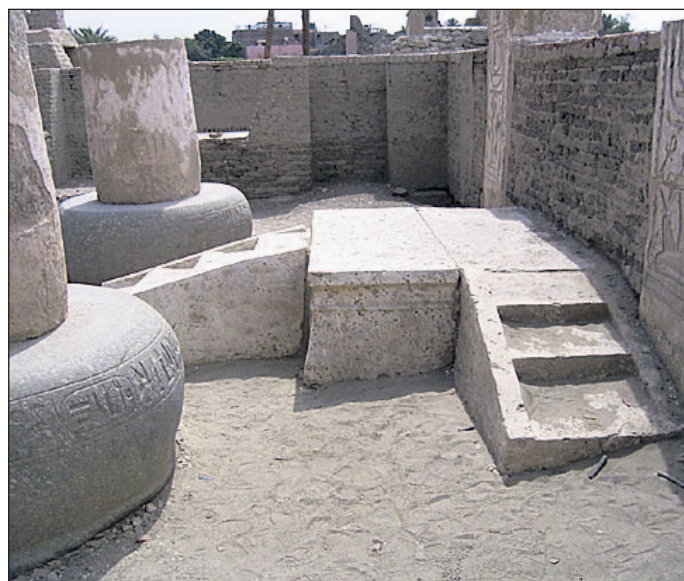
Die Reste des Tempels von Ramses III. stehen noch – auch lange nach dem Ende der großen ägyptischen Zeit.

Auf der frei werdenden Fläche ziehen die Archäologen ein, um zu untersuchen, was sich alles unter den alten Häusern befindet. Es geht ja die Geschichte herum. Das sich unter den Häusern manch' geheimer Eingang zu verborgenen Gräbern befinden soll. Die ersten Ausgrabungen sind auf den frei gewordenen Flächen schon erfolgt. Für einige Bewohner war das „Haus“ eben doch eine kleine