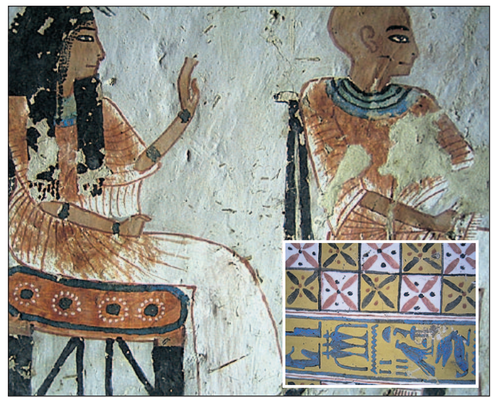
Wandmalereien im Grab des Roy. Sie zeigen den Grabherrn mit seiner Frau an einem reich gedeckten Gabentisch. Die Decke der Grabkammer (kl. Foto) ist mit Hieroglyphen und dem Namen Ramses bedeckt.

Um seinen Namen auch wirklich für die Nachwelt zu erhalten oder aus Erfahrung schlau geworden (die nachfolgenden Pharaonen „klaubten“ ihren Vorgängern gern Bauten und Leistungen), ließ Ramses III. seinen Namen