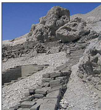
Die Grabungen des Deutschen Ägyptologischen Institutes (DAI) in El Qurna.

Doch ich möchte mit Ihnen ein kleines, neben der Grabungsstelle befindliches Grab besuchen, um so die Schönheit eines Grabes der Noblen zu zeigen. Wir besuchen das Grab des Roy eines Edlen/Grafen der 18. Dynastie (etwa 1570 bis 1293 vor Christus).