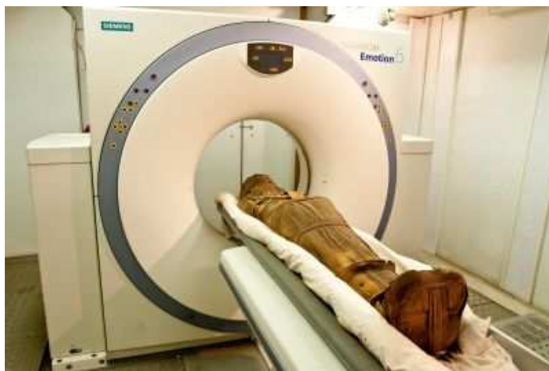
Die männliche Mumie ist 3.000 Jahre alt und zeigt im CT Arterienverkalkung.