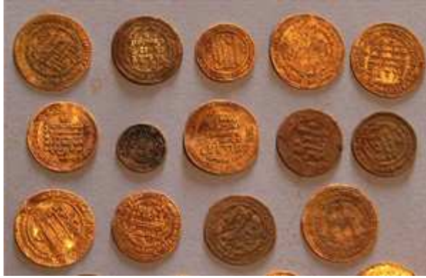
Einige der weitgehend unbeschädigten Münzen