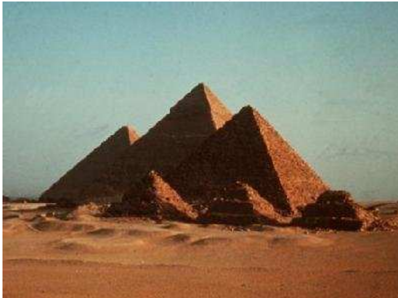
Die Pyramiden von Gizeh sind vom Verfall bedroht.

MÜNCHEN/DPA. Seit Jahrtausenden trotzen die Pyramiden von Gizeh dem Zahn der Zeit - doch in den vergangenen Jahrzehnten haben Mensch und Umwelt ihnen besonders heftig zugesetzt. Ähnlich ergeht es Denkmälern, Kunstwerken und historischen Gebäuden auf der ganzen Welt. Welche Auswirkungen der Klimawandel und die Touristen-Ströme auf die Weltkulturerbestätten der UNESCO haben und wie man sie schützen kann, untersucht das