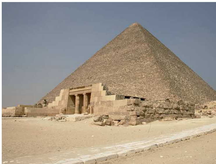
Die Cheops-Pyramide in Gizeh