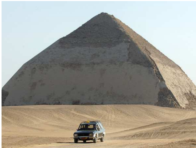
Die Knickpyramide von Dahschur

Berüchtigt ist Snofrus sogenannte Knickpyramide in Dahschur. Der Bau soll etwa 125 Meter in die Höhe ragen, aber der Boden gibt nach und Risse ziehen sich durch die Kammern im Inneren. In einem verzweifelten Rettungsversuch flachen die Baumeister den Neigungswinkel der Pyramide auf halber Höhe ab. Ohne Erfolg: Die Knickpyramide wird die größte Bauruine Ägyptens. Als Ersatz für seine missratene Ruhestätte beginnt Snofru den Bau der "Roten Pyramide". Sie wird als erste mit waagrecht umlaufenden Steinschichten gebaut. Das verringert den Druck auf die Kammern im Inneren und das Bauwerk bleibt stehen – bis heute. Die "Rote Pyramide" ist die dritthöchste in Ägypten.